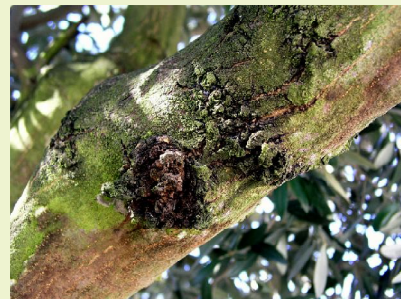
Tumor formado num tronco