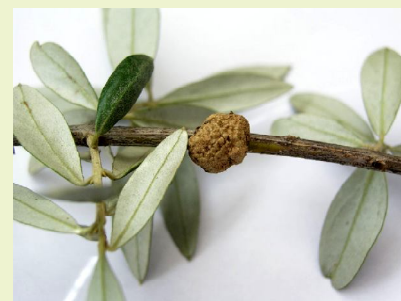
Tumor formado num ramo