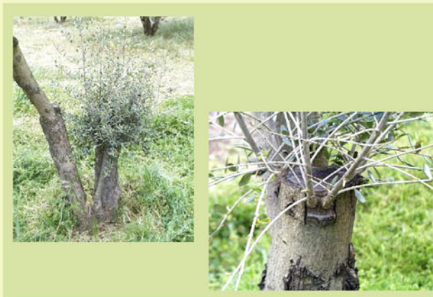
Aspecto da enxertia após um ano.

Quando tal não acontecer e desde que a borbulha esteja verde, não deve ser destruída porque se pode tratar de gomos dormentes.